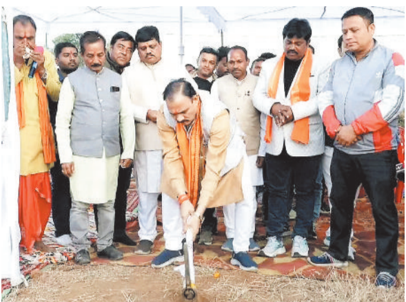
भूमिपूजन करते स्वास्थ्य मंत्री

एमसीबी जिले के चिरमिरी में तकनीकी शिक्षा के क्षेत्र को नई ऊंचाइयों पर ले जाने की दिशा में एक ऐतिहासिक पहल के तहत 21 दिसंबर को 9 करोड़ 11 लाख 44 हजार रूपए की लागत से बनने वाले नवीन शासकीय पॉलिटेक्निक चिरमिरी भवन का भूमिपूजन समारोह गरिमायय एवं उत्साहपूर्ण वातावरण में संपन्न हुआ। इस अवसर पर स्वास्थ्य मंत्री श्याम बिहारी जायसवाल मुख्य अतिथि के रूप में उपस्थित रहे।