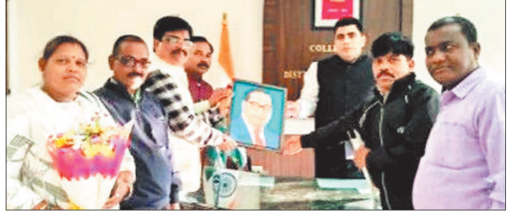
कलेक्टर को ज्ञापन सौंपते भूविस्थापित।

उल्लेखनीय है कि कि एसईसीएल, एनटीपीसी, सीएसईबी और बालको जैसे बड़े औद्योगिक घरानों की स्थापना के लिए स्थानीय ग्रामीणों और आदिवासियों ने अपनी पूर्वजों की पैतृक भूमि का त्याग किया था। समिति ने कलेक्टर को अवगत कराया कि वर्तमान में यह परिवार न केवल अपनी पंचायत छोड़ चुके हैं, बल्कि रोजगार, उचित पुनर्वास और बुनियादी नागरिक सुविधाओं (बसाइट) के अभाव में एक अनिश्चित भविष्य से जूझ रहे हैं। समिति ने कलेक्टर से आग्रह किया है कि विस्थापन से संबंधित