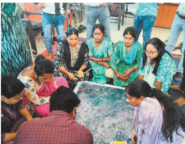
स्थिति के अनुसार गांव की आवश्यकता और उपयोग को ध्यान रखकर आगामी समय में कराए जाने वाले कार्यों को चिह्नित किया जा रहा है।

जिले के सभी ग्राम पंचायतों में तकनीकी का बेहतर उपयोग कर अत्याधुनिक तरीके से गांवों के विकास का त्वरित प्लान बनाया जा रहा है। इसके लिए युक्तधारा पोर्टल पर गांव के मैपिंग के साथ उस गांव में आम नागरिकों की मांगों के अनुसार कार्यों का चिह्नकन किया जा रहा है। ग्रामीण विकास को अधिक प्रभावी, पारदर्शी और दूरगामी परिणाममूलक बनाए जाने के लिए यह अभिनव प्रयोग किया जा रहा है।