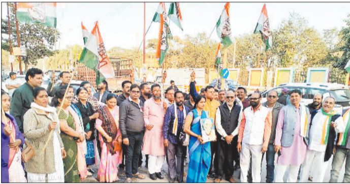
विरोध प्रदर्शन करते कांग्रेसी।