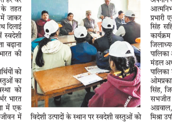
विदेशी उत्पादों के स्थान पर स्वदेशी वस्तुओं को

मनेन्द्रगढ़। स्वदेशी अभियान के अंतर्गत हर घर स्वदेशी, घर-घर स्वदेशी कार्यक्रम के तहत मनेन्द्रगढ़ नगर के विभिन्न विद्यालयों में जाकर विद्यार्थियों को स्वदेशी अपनाने की शपथ दिलाई गई। इस अभियान का उद्देश्य बच्चों में स्वदेशी वस्तुओं के उपयोग के प्रति जागरूकता बढ़ाना तथा उनमें राष्ट्रप्रेम और आत्मनिर्भर भारत की भावना को मजबूत करना रहा।